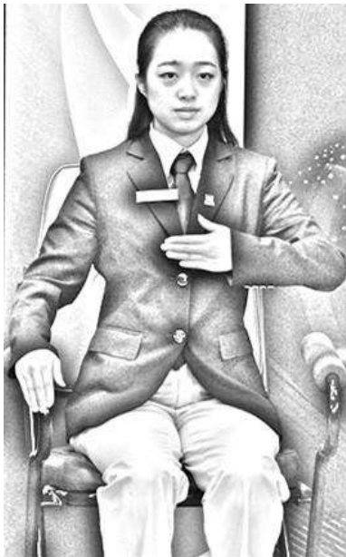
Slika 7: Zakrito s kom ali s čim

Povedal: zakrito s kom ali s čim (Hidden by what or whom ); telesom, komolcem, ramo, glavo ali partnerjem; Hidden by (body, elbow, shoulder, head or partner) in Pokazal: