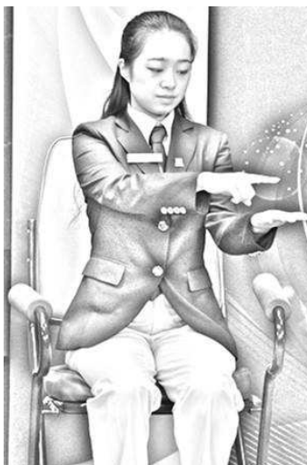
Slika 1: Ni dovolj visoko

2. Če se servis ni začel iz odprte dlani serverjeve proste roke, bo sodnik ali pomočnik: