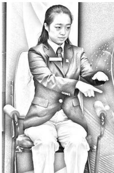
Slika 4: Pod nivojem igralne površine

Povedal: pod nivojem igralne površine (Below the playing surface) in Pokazal: