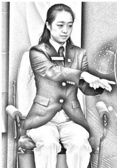
Slika 3: Žogica na prstih

Povedal: žogica na prstih (Ball resting on the fingers) in Pokazal: