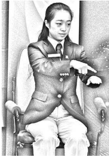
Slika 5: Pred končno linijo

Povedal: pred končno linijo (Inside the end line) in Pokazal: