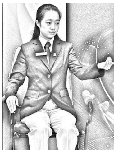
Slika 2: Dlan ni odprta