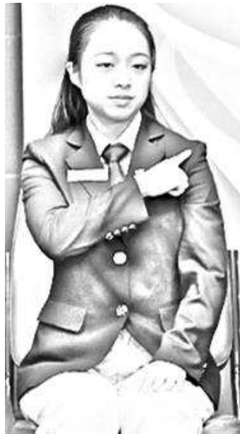
Zakrito z ramo

Pomembno je, da tako sodnik kot pomočnik lahko dosodita napako in jo vsak lahko tudi obrazloži po sprejetih določilih, seveda pa točke vedno dodeli le sodnik dvoboja.